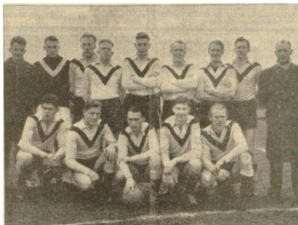
Het kampioenselftal van De 1901.

Dit is geen wonder, want De Kooi is voor het laatst in 1936 kampioen geweest. In 1935 miste men op een punt na de eerste klasse en in 1936 was men voor het laatst kampioen van de tweede klasse. Hierna is men langzamerhand afgezaakt. In 1942 volgde degradatie naar de derde en in 1955 degradatie naar de vierde klasse na een beslissingswedstrijd met Bergum, dat op het ogenblik onderaan staat in de derde klasse A. Nu mogen de Jousers in de komende promotiewedstrijden proberen om een deel van het verloren gegane terrein terug te winnen. Onze hartelijke gelukwensen.